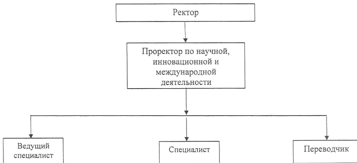
Схема отдела международной деятельности