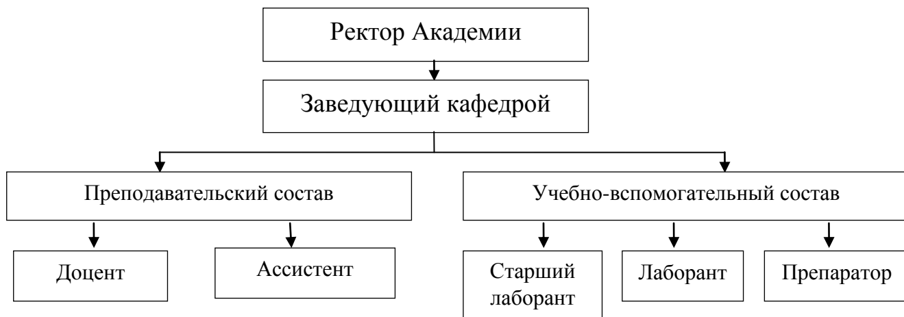
Схема организационной структуры Кафедры акушерства и гинекологии