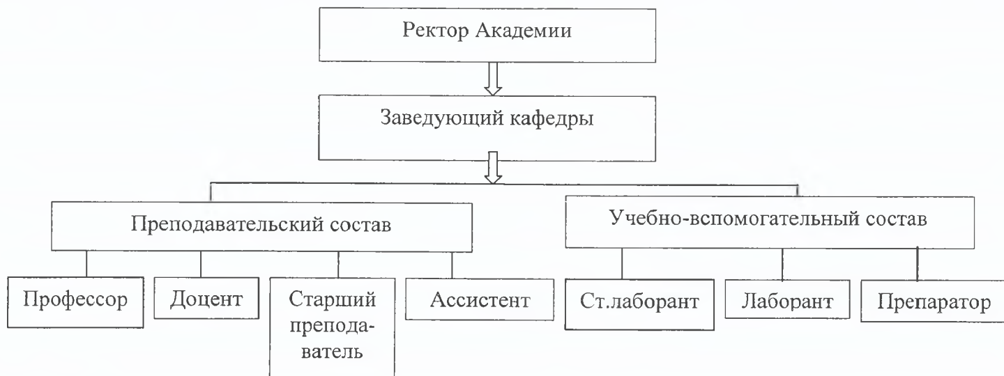
Схема организационной структуры Кафедры гигиены и эпидемиологии